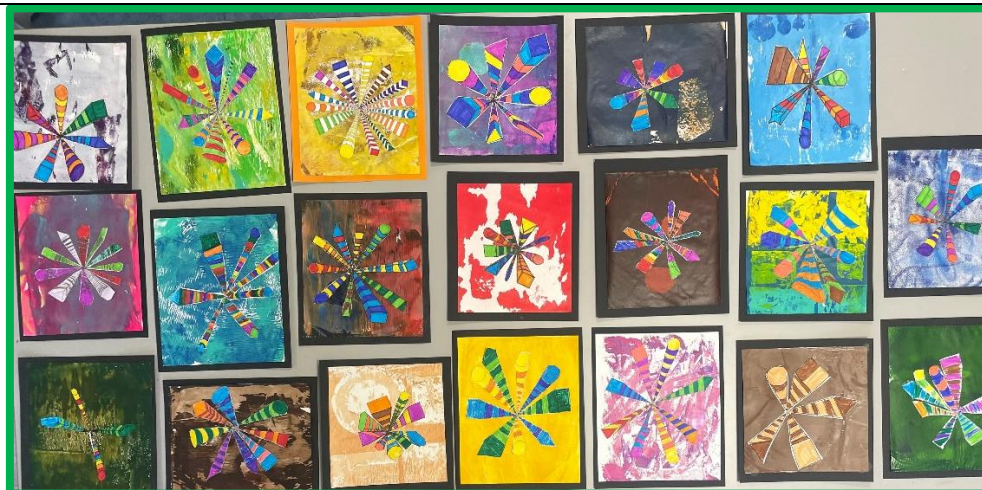
3. klasses perspektivtegninger

I 4. klasse blev arbejdet med perspektiv videreudviklet med fokus på étpunktsperspektiv. Eleverne blev introduceret til teknikken gennem video og øvelsestegninger med vej, huse og træer. Der blev arbejdet bevidst med at identificere horisontlinjen, og i den afsluttende opgave anvendte eleverne perspektiv i egne, selvvalgte motiver. Der ses en tydelig progression fra 2. klasse, idet eleverne i højere grad kunne arbejde selvstændigt og anvende perspektiv som et bevidst billedmæssigt virkemiddel.